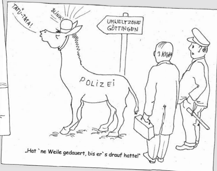
Auch die Polizei arbeitet an Alternativen.